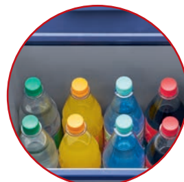
Für alle handelsüblichen 0,75 / 1,0 / 1,5 / 2,0 Liter-Flaschen