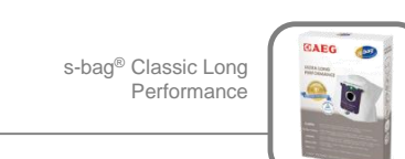
s-bag® Classic Long Performance