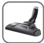
DustPro™ Bodendüse für Staubaufnahme auf allen Böden.